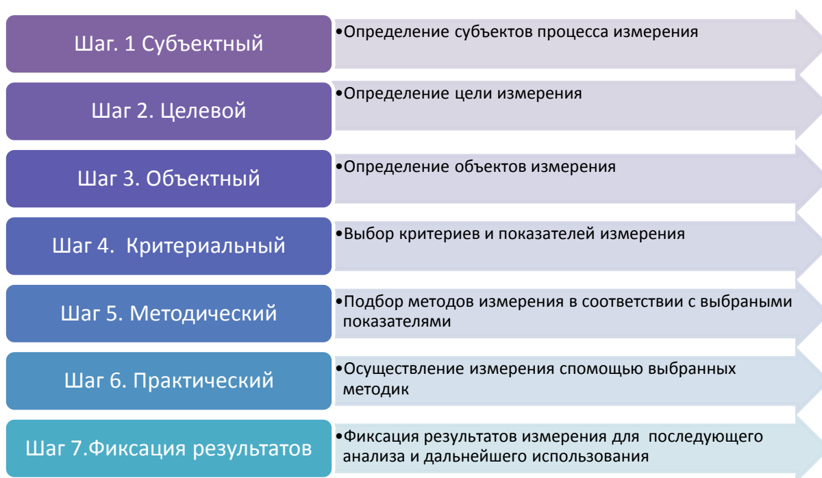
Рис. 4 Алгоритм измерения инноваций

Указанные этапы могут быть разделены на 7 шагов, которые представлены на рисунке 4