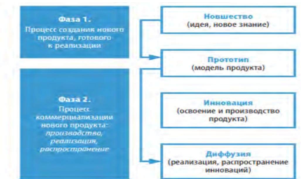
Рис. 1. Обобщенное представление фаз инновационного процесса

Обобщенно указанные стадии можно свести к двум фазам инновационного процесса, приведенным на рисунке 1.